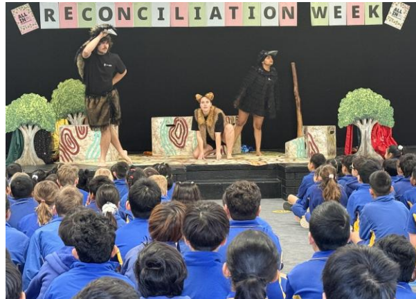
1-이라 야킨 극단

학교 구성원 모두가 안전하게 지낼 수 있는 환경을 조성하는 데 변함없는 성원을 보내주셔서 감사합니다.